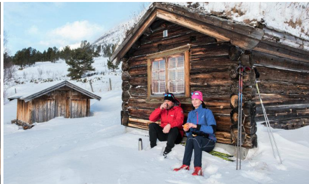
Un tour pour amateurs de nature