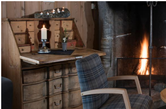
Coin romantique au Lemonsjøe Fjellstue

Hébergement à l'hôtel Lemonsjøen en chambre double avec salle de bain